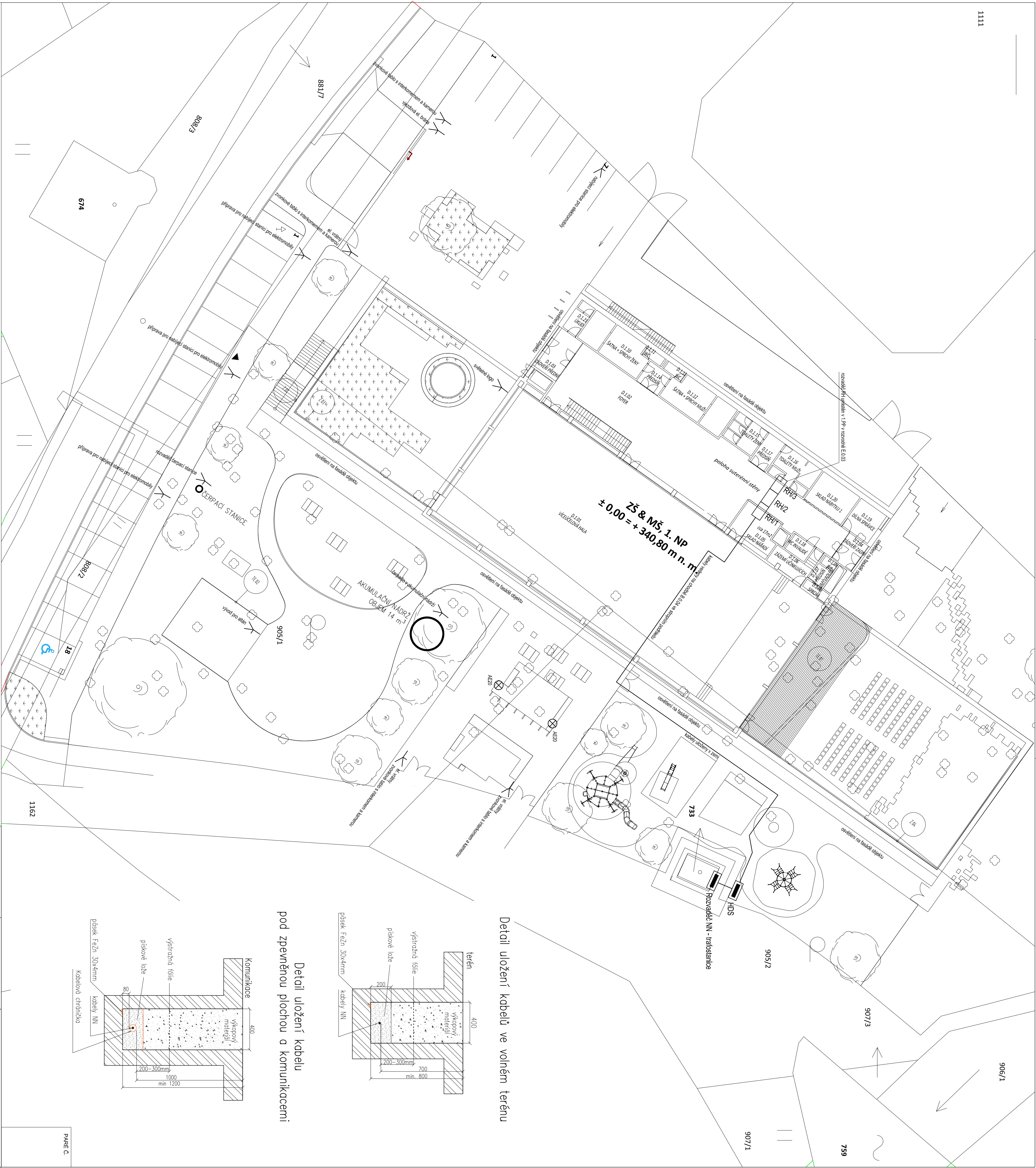
Detail uložení kabelů ve volném terénu